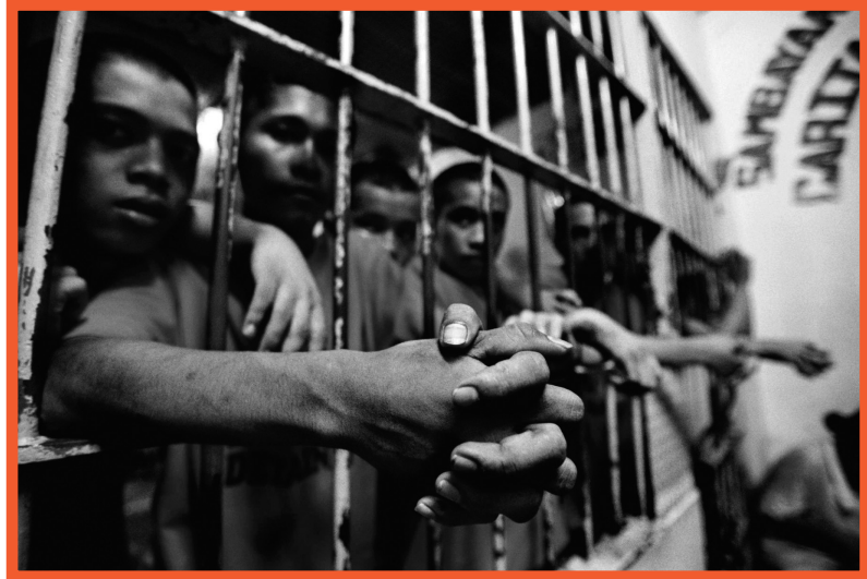
Duizenden jongeren melden zich aan bij de gevangenis, uit schrik te worden vermoord op straat

Zoals een gevangene me op een dag zei, toen ik bezoeker was in een Franse gevangenis : "wanneer ik binnen moest in de