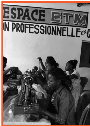
Opleiding snit & naad voor de tienermoeders

Momenteel worden er 59 kinderen en jongeren, inclusief 15 meisjes, opgevangen in het huis, en niet minder dan 300 kinderen lopen er school,